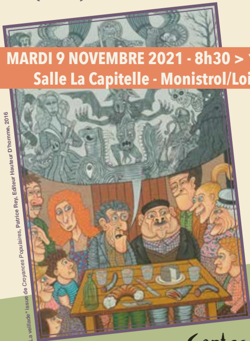
«La multitude» issue de Croyances Populaires, Patrice Roy, Editeur Hauteur D'homme, 2016

MARDI 9 NOVEMBRE 2021 - 8h30 > 17h30 Salle La Capitelle - Monistrol/Loire